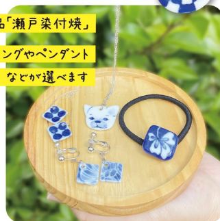
伝統的工芸品「瀬戸染付焼」イヤリングやペンダントなどが選べます