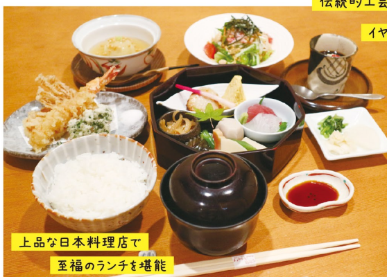
上品な日本料理店で至福のランチを堪能